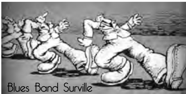
Blues Band Surville