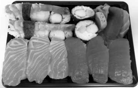
Exemple formule Sakura