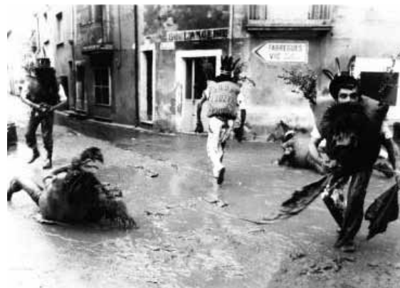
Pailhasses à Courmonterral