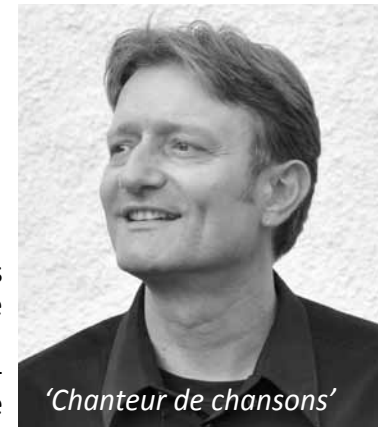
'Chanteur de chansons' brunoperren.unblog.fr

auteur-compositeur-interprète, chante Brassens, Lapointe, Trenet, Ferrat... Perren !