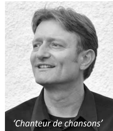
'Chanteur de chansons'

C'est donc ce concert que nous vous proposons cette année, à l'occasion d'un grand pique-nique sur le site de Boussecos.